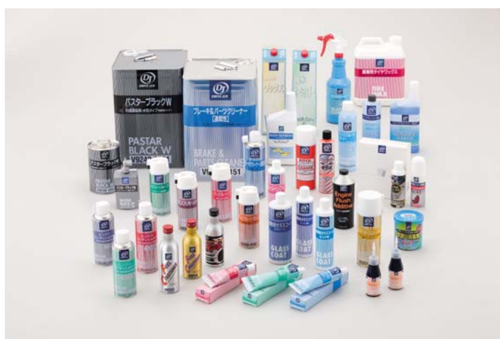
(ケミカル系商品群)