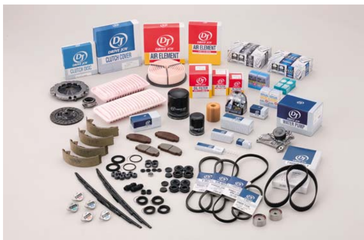
(補修部品系商品群)