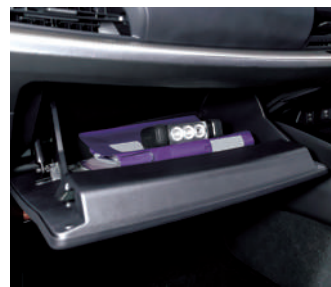
グローブボックス