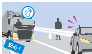
安全な場所へ退避