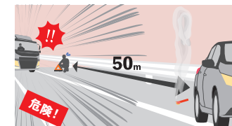
車両の50m後方へ三角表示板を設置