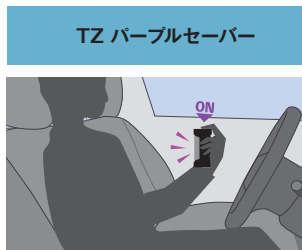
TZ パープルセーバー