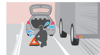
車外で三角表示板を組み立て