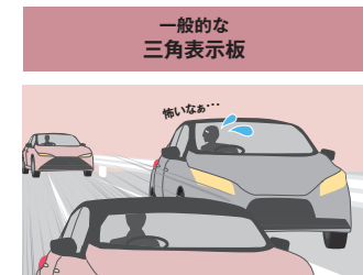
一般的な 三角表示板