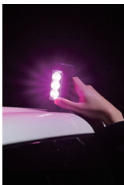
マグネットで車両に簡単設置可能