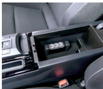
コンソールボックス