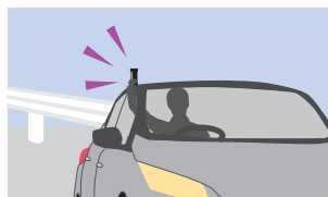
車内からパープルセーバーを設置