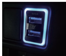
エンジンをかけた状態

エンジンをかけると LEDがブルーに点灯 充電中はLEDがオレンジに点灯し、 完了後はブルーに点灯